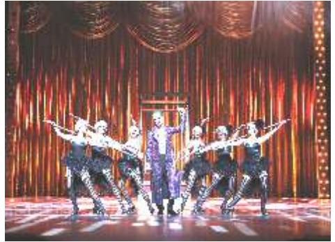
Staatsoperette Dresden

Bertolt Brechts 1928 uraufgeführte „Die Dreigroschenoper“ gehört zu den meistgespielten Theaterstücken des 20. Jahrhunderts. Kurt Weill schuf in seiner Musik einen unverwechselbaren Stilmix aus den Modetänzen der späten 1920er Jahre. Die Handlung kreist um den Konkurrenz- und Existenzkampf zwischen zwei „Geschäftsleuten“, dem Kopf einer Londoner Bettelmafia und dem Verbrecher Macheath, der gute Beziehungen zum Polizeichef Brown von London hat.