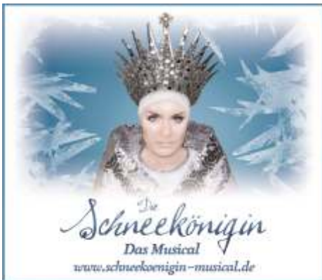
Die Schneekönigin, Fotografin: L. Duhs

An einem kalten Wintertag, an dem der Schnee besonders dicht fällt, bekommt Kai Besuch von der Schneekönigin. Ihre seelenlose Kälte bemächtigt sich seines Herzens und verschleppt ihn in ihr eiskaltes Reich. Die mutige Gerda lässt nichts unversucht, um ihren Liebsten Kai zu finden. Eine abenteuerliche, zauberhafte und gefährliche Reise liegt vor ihr. Lassen wir uns in die zauberhafte Welt des Märchens entführen.